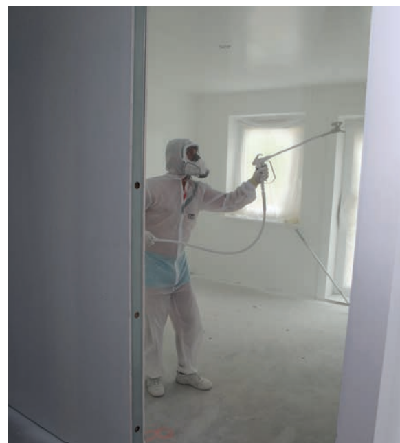
Binnen nemen de schilders van Van de Kerkhof in totaal ruim 50.000 vierkante meter onder handen

De planning halen met behoud van kwaliteit is de grootste uitdaging bij project EdelPark, concludeert Van de Kerkhof. "Het voordeel is dat je op deze projecten van TVU Bouw steeds met dezelfde ploegen werkt. Als je problemen tegenkomt, los je die met elkaar op. Omdat je weet wat het gemeenschappelijke belang is. Iedereen heeft tegenwoordig de mond vol van 'lean', maar de essentie is dat je elkaar in de keten vasthoudt. De een kan pas verder als de ander foutvrij oplevert. Dat vraagt oprechte interesse in de werkzaamheden van diegenen die voor én na jou in de keten zitten. Dat wordt in de praktijk vaak vergeten. Hier loopt het echter als een trein. In januari realiseerden we drie proefwoningen en voor de bouwvak hadden we tweehonderd appartementen gereed. Het slopen begon eind november en dit najaar is de oplevering. In nog geen jaar tijd voeg je straks 240 woningen toe aan de woningmarkt. Dat is toch prachtig?" •