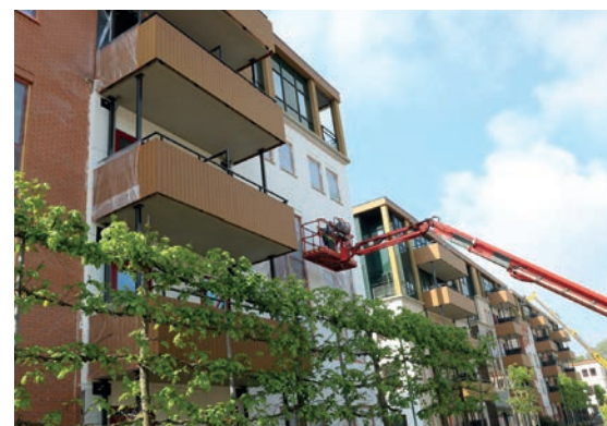
Er wordt vanuit meerdere hoogwerkers tegelijk gewerkt