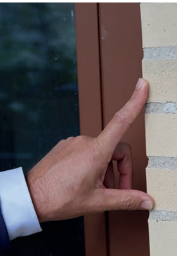
De keiharde verblendsteen vroeg een 'hybride' grondlaag op basis van silicaat én acrylaat