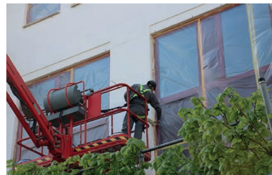
Alle buitengevels worden afgewerkt met Sytilot NQG